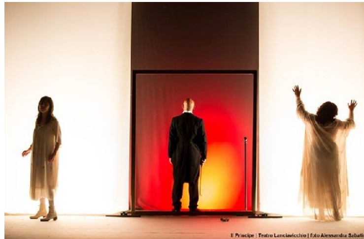
Il Principe | Teatro Lencicchio